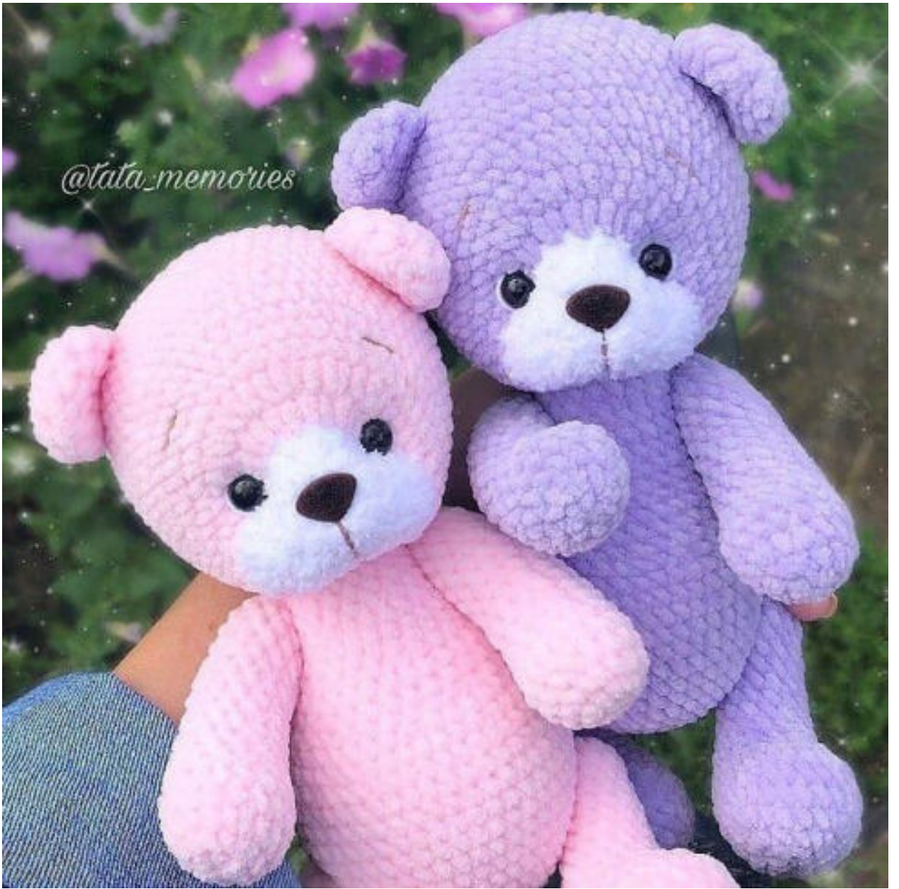
Автор: Татьяна Разуваева (tata_memories)