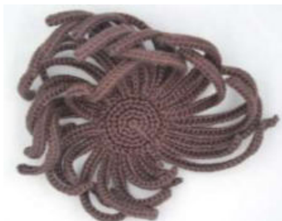
Фасад работы не должен быть виден