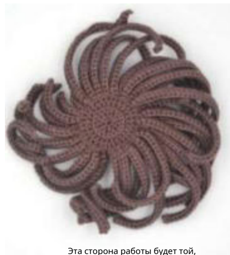
Эта сторона работы будет той, которую вы видите