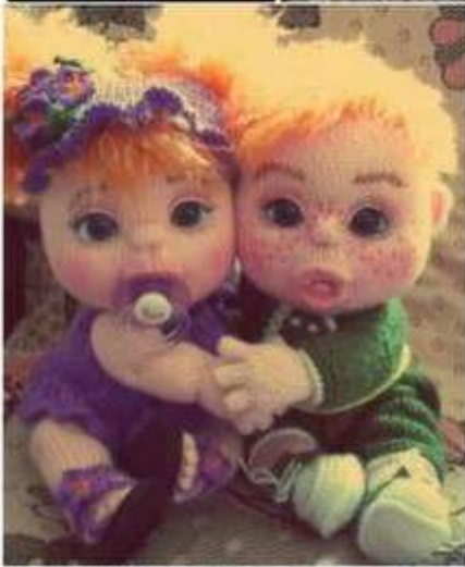
Бонус мастер-класс глаз