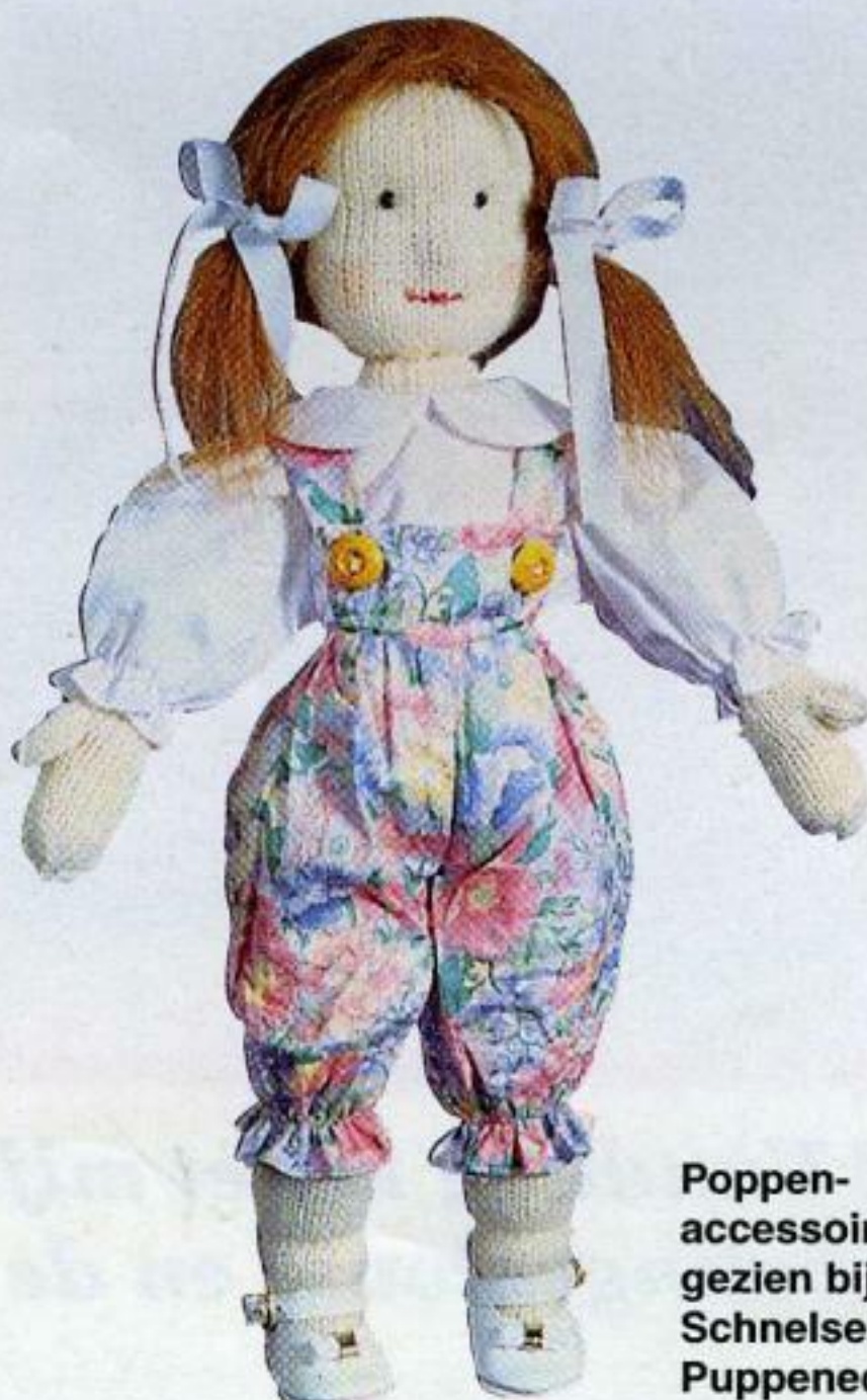
Poppen- accessoires gezien bij Schnelsener Puppenecke