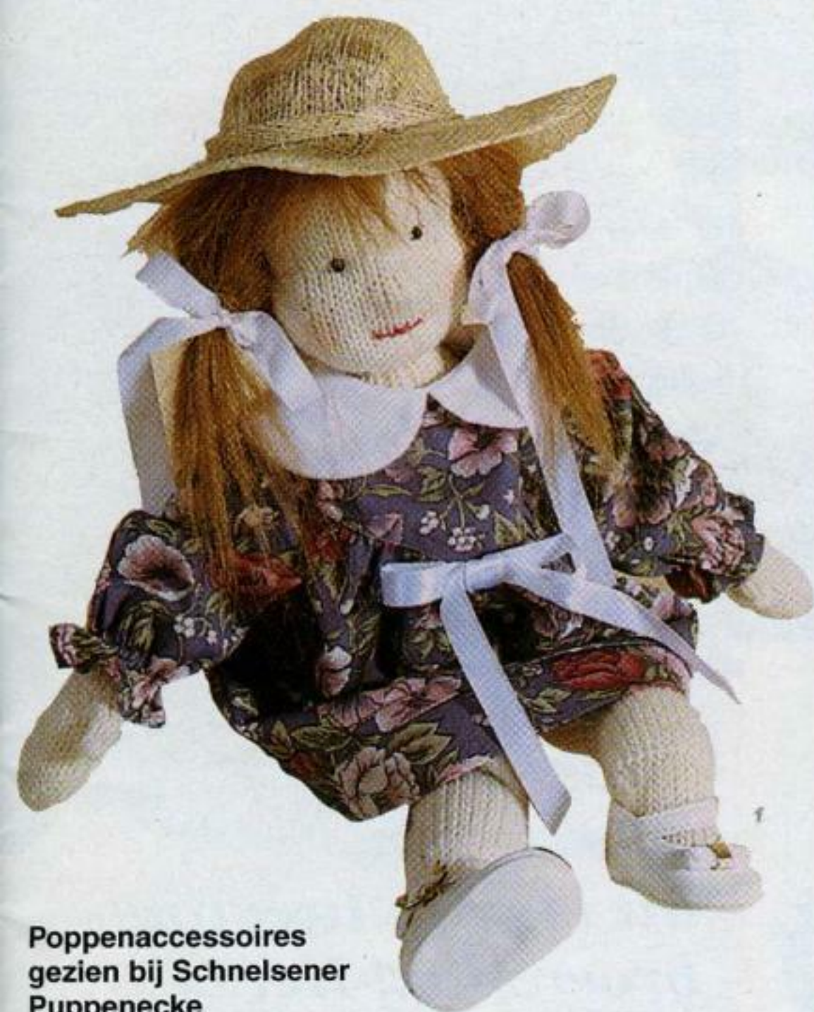
Poppenaccessoires gezien bij Schnelsener Puppenecke