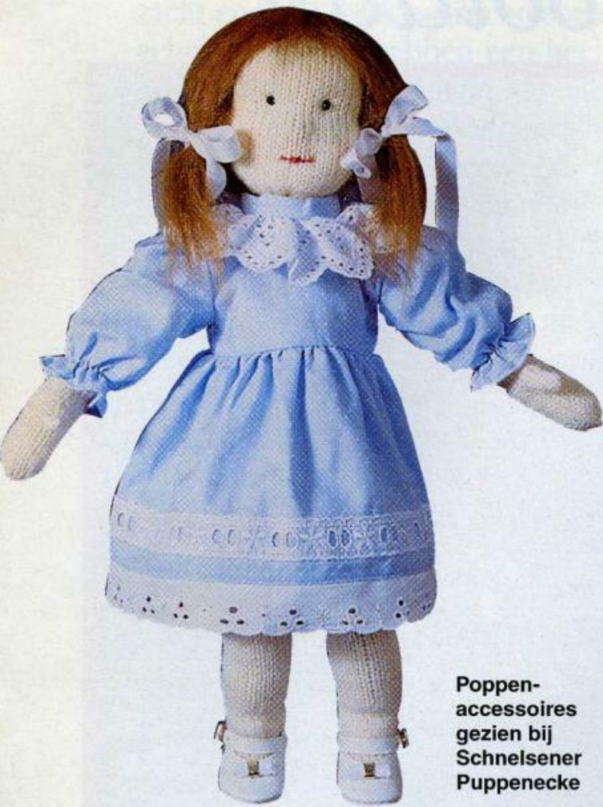
Poppen- accessoires gezien bij Schnelsener Puppenecke

nld. r. sabr. en de 1e 2 st. van de 4e nld. overhalen sa.br. (= 1 r. afh., 1 r., de afgehaalde st. erover halen) = 20 st. (= 5 st. per nld.). Na 3 cm. vanaf de hak voor de teen als volgt mind: 1e+3e rd.: de 2e+3e laatste st. van de 1e nld. r. sa.br. en in de 2e+3e st. van de 2e nld. overhalen sa.br.; 2e+4e rd.: zonder mind. 5e rd.: de 2e+3e laatste st. van de 1e+3e nld. r. sa.br. en de 2e+3e st. van de 2e+4e nld. overhalen sa.br.; de st. over 2 nld. verdelen en in de volg. rd. steeds de 2e+3e laatste st. r. sa.br. en de 2e+3e st. overhalen sa.br.; de ov. 8 st. met de dr. sa.trekken.