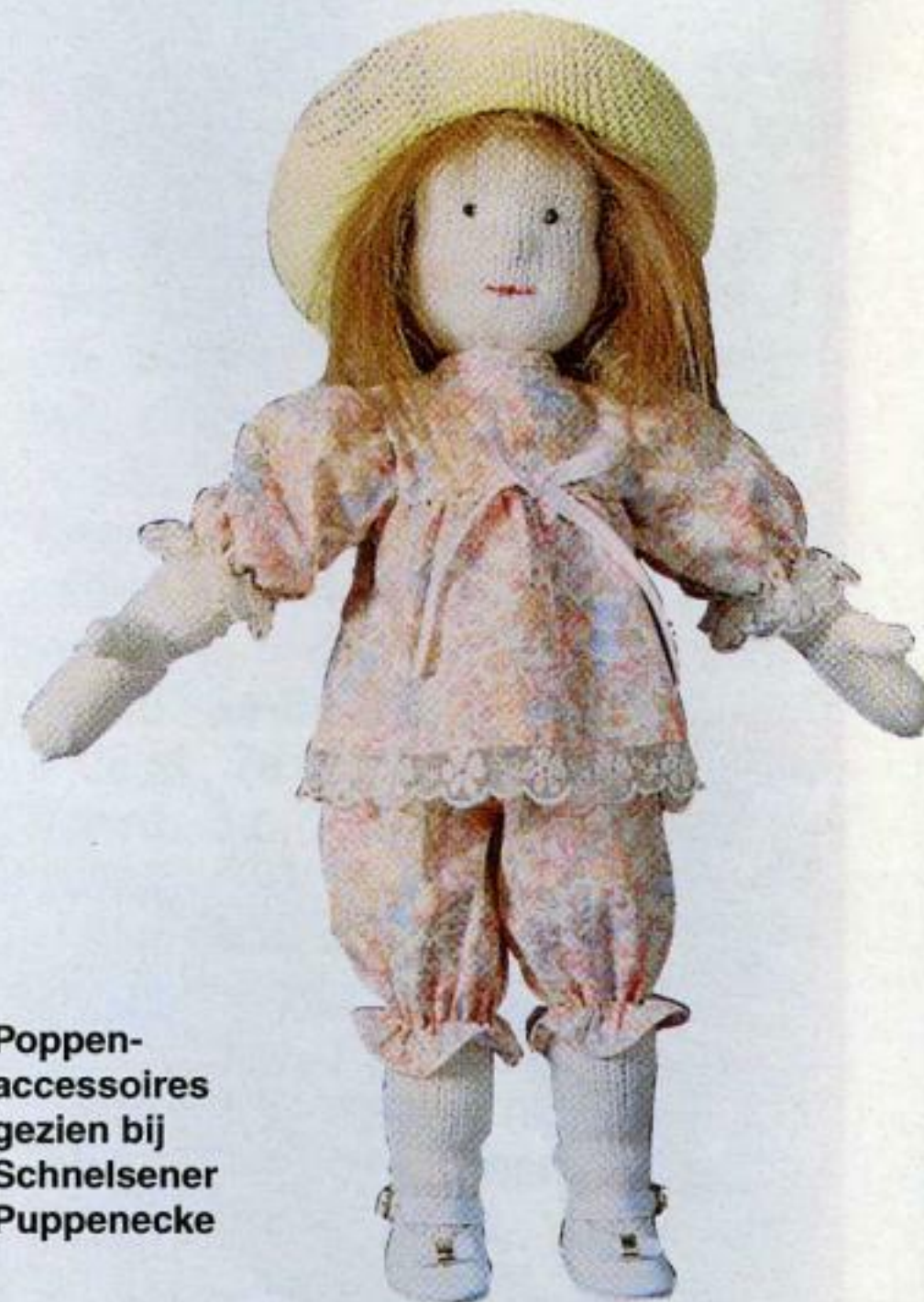
Poppen- accessoires gezien bij Schnelsener Puppenecke

midd. 12 st. over elk 1 st. en 6 nld.; aan het voorpand abz. van de midd. 8 st. elk 5 st., daarover abz. van de midd. 10 st. elk 3 st. en nog abz. van de midd. 12 st. elk 1 st. over 4 nld. Aan de bandeinden de dr. doorhalen en deze aan de schouder tot een strik binden.